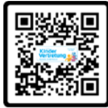
Sexueller Missbrauch von Kindern