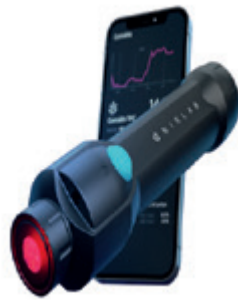
Abb. 2: NIR-Spektrometer Typ MicroNIR. 7

Weitere Geräteklassen arbeiten auf der Grundlage von masseselektiven oder chromatographischen Verfahren. Diese sind jedoch meist deutlich aufwändiger in der Bedienung und nicht wirklich mobil, so dass hier darauf nicht weiter eingegangen werden soll. Zur Überprüfung der grundsätzlichen Anwendbarkeit der Spektrometer für die Voruntersuchung von Rauschgift-Asservaten wurden in jüngster Zeit in verschiedenen forensischen Laboren praxisnahe Tests durchgeführt. 8, 9 Dabei wurden unter anderem die in der täglichen Polizeiarbeit sichergestellten Asservate sowohl auf klassischem Wege mit den verfügbaren Drogen-Schnelltests als auch mit den optischen Spektrometern untersucht und es wurden die Qualitätskenngrößen der jeweiligen Verfahren ermittelt.