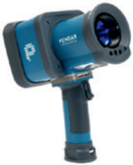
Abb. 1: Raman-Spektrometer Typ Pendar X10. 6

Gerätearten sind sog. Infrarot-(IR)-Spektrometer, Nah-Infrarot-(NIR)-Spektrometer oder Raman-Spektrometer. Nachfolgend sind zwei derartige Geräte beispielhaft abgebildet. Raman-Spektrometer sind in der Regel komplexer aufgebaut, größer und teurer in der Anschaffung als NIR-Spektrometer.