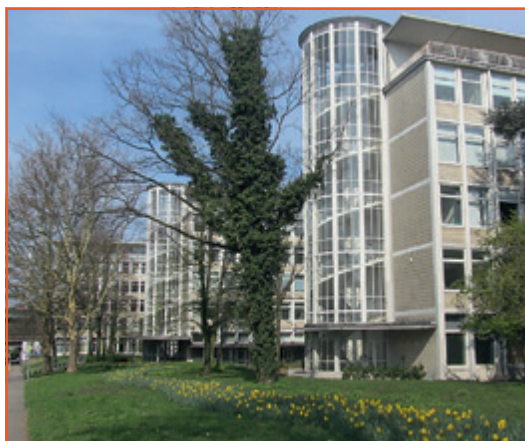
Hochschule für Öffentliche Verwaltung Bremen (HfÖV).