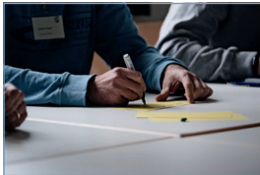
Im Rahmen des Workshops wurden die Inhalte mit der Metaplantchnik erarbeitet und visualisiert.

Die landesübergreifende Zusammenarbeit hat sich als sehr hilfreich erwiesen, ein großer Dank geht hier in Richtung Niedersachsen und Hamburg. Für die Zukunft ist vorstellbar, Angehörige der Kriminalpolizei als Zielgruppe zu erfassen. Diese erfahren im Bachelorstudium in Schleswig-Holstein im Rahmen des Praxissemesters (Grundpraktikum) eine Einweisung in Grundlagen der Drogenerkennung. Darüber hinaus ist eine Ausbildung dieses Personenkreises zum Drogenerkennung in der Fortbildung nur sehr selten festzustellen. Das Erkennen von durch Drogen beeinflussten Beschuldigten ist bei Delikten der Kriminalpolizei ebenfalls von Bedeutung und so könnte eine an den Personenkreis angepasste Fortbildung in diesem Segment für mehr Handlungssicherheit sorgen.