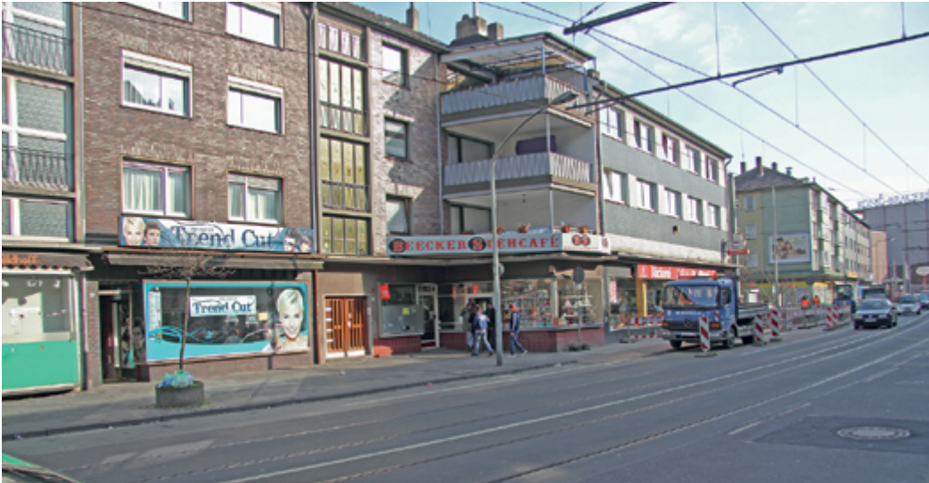
Abb. 2: Übersicht Tatort, Fahrtrichtung Brauerei (Süden).