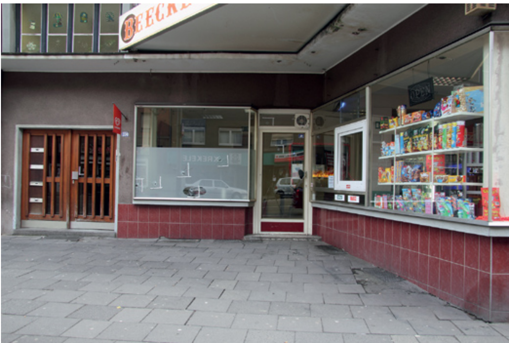
Abb. 3: Kiosk mit Schussbeschädigungen 1 bis 10.

Die Ergänzung des Tatortbefundberichtes durch Lichtbilder vermittelt einen recht genauen und objektiven Eindruck der Tatortsituation. Darüber hinaus unterliegen die Fotos eben nicht der selektiven Wahrnehmung, so dass, wenn sie nach den Grundsätzen der kriminalistischen Fotografie gefertigt werden, auch Details erfasst werden, die der Verfasser des objektiven Befundes zunächst als unwichtig erachtet hat. In Zeiten von Arbeitsverdichtung und Personalknappheit muss es allerdings erlaubt sein, auch über Arbeitsökonomie nachzudenken, wenn damit keine Qualitätseinbußen einhergehen.