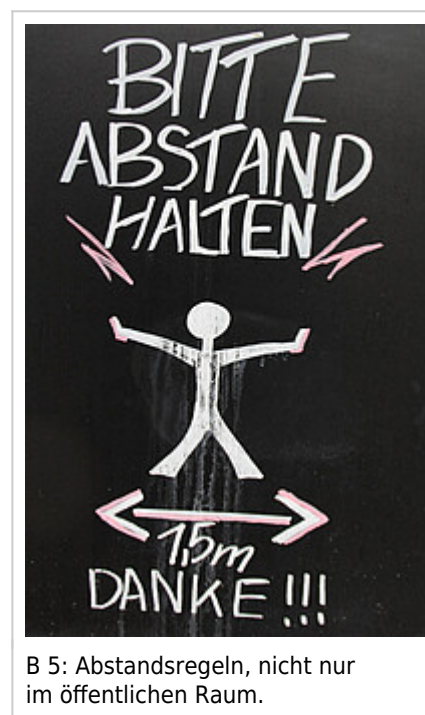
B 5: Abstandsregeln, nicht nur im öffentlichen Raum.

Kriminalpolizei: Die Meinungen gehen in der öffentlichen Diskussion weit auseinander. Während beispielsweise der Publizist René Schlott in einem Gastbeitrag für die Süddeutsche Zeitung die Befürchtung äußert, dass die offene Gesellschaft erwürgt wird (SZ, 17.3.2020), weist dies Baden-Württembergs Ministerpräsident Winfried Kretschmann ausdrücklich zurück und stellt fest: Wir opfern keine Freiheitsrechte, sondern schränken sie nur zeitweise ein (ARD/dpa, 1.4.2020). Wer hat in diesem Fall recht?