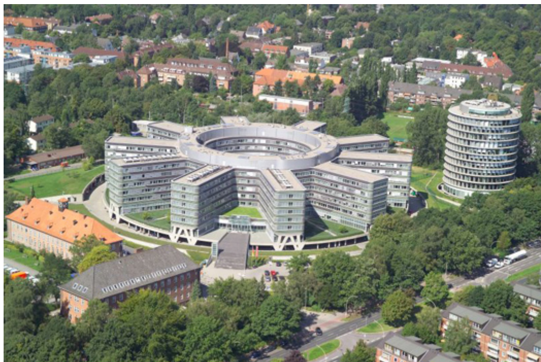
B 2: Polizeipräsidium Hamburg.