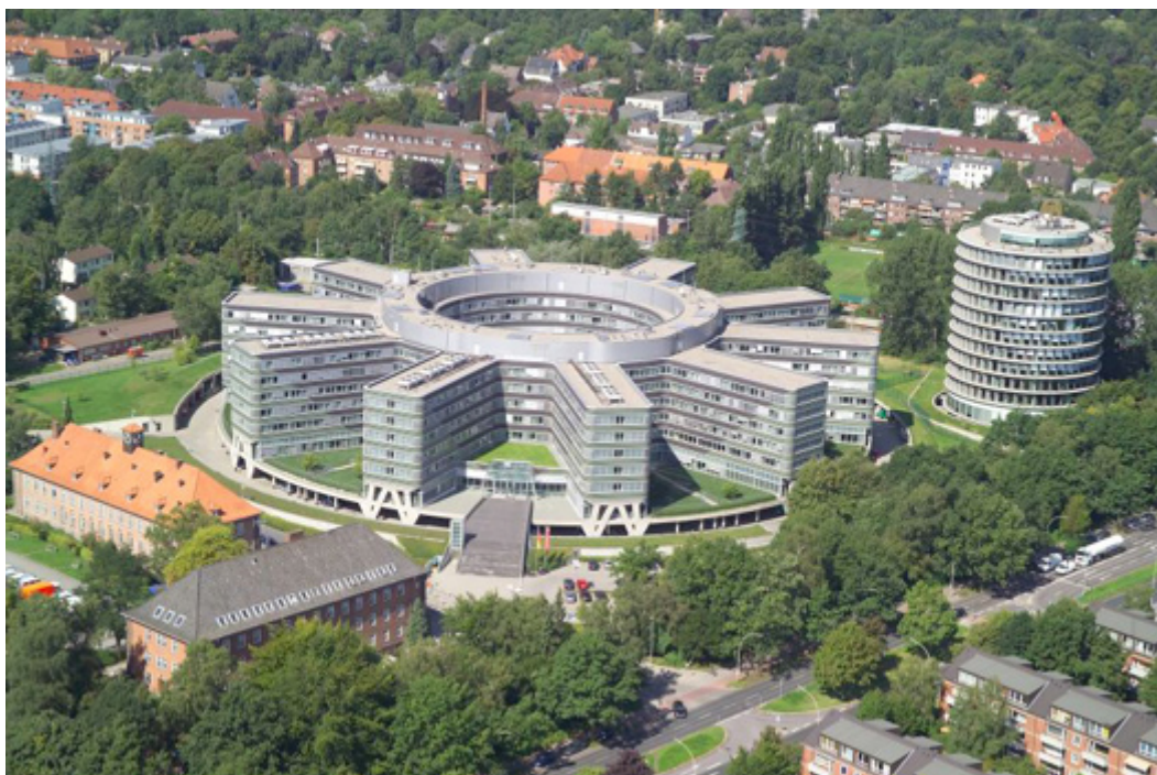
B 2: Polizeipräsidium Hamburg.