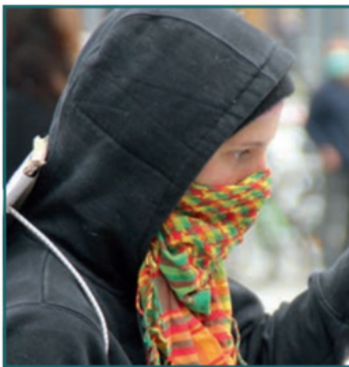
B 3, 4: „Vermummungsgebot“ bei Versammlungen in Kiel während der Coronakrise.

Michael Wilksen: Um unnötigen Infektionsrisiken zu begegnen, hat die Landespolizei eine Reihe interner Maßnahmen ergriffen. Der Aus- und Fortbildungsbetrieb in der Polizeidirektion für Aus- und Fortbildung und für die Bereitschaftspolizei Eutin (PD AFB) und der Fachhochschule für Verwaltung und Dienstleistung Altenholz (FHVD) fand nicht mehr in der gewohnten Weise statt. Die Dienstanfänger erarbeiteten sich den Unterrichtsstoff abgestuft im Selbststudium und wurden dabei von den Dozentinnen und Dozenten intensiv unterstützt und begleitet. Wichtig ist aber, dass es keinen Stillstand geben durfte und darf. Wir sind auf die gut und umfassend ausgebildeten Nachwuchskräfte angewiesen. Es ist dank des Engagements und der Kreativität der Beteiligten gelungen, sowohl die Ausbildung als auch das Studium situationsgerecht und rechtssicher zu gestalten und zum 1.8.2020 in den jeweiligen Jahrgängen abzuschließen. Dabei haben wir in sehr kurzer Zeit durchaus positive Erfahrungen mit digitalem Lernen gemacht, welches sicherlich mittelfristig und auch zukünftig einen höheren Stellenwert in der Landespolizei erhalten dürfte. Diese Facette der Corona-Pandemie begreifen wir als Chance und Motor, den eingeschlagenen Weg auch künftig fortzusetzen.