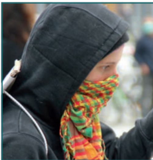
B 3, 4: „Vermummungsgebot“ bei Versammlungen in Kiel während der Coronakrise.