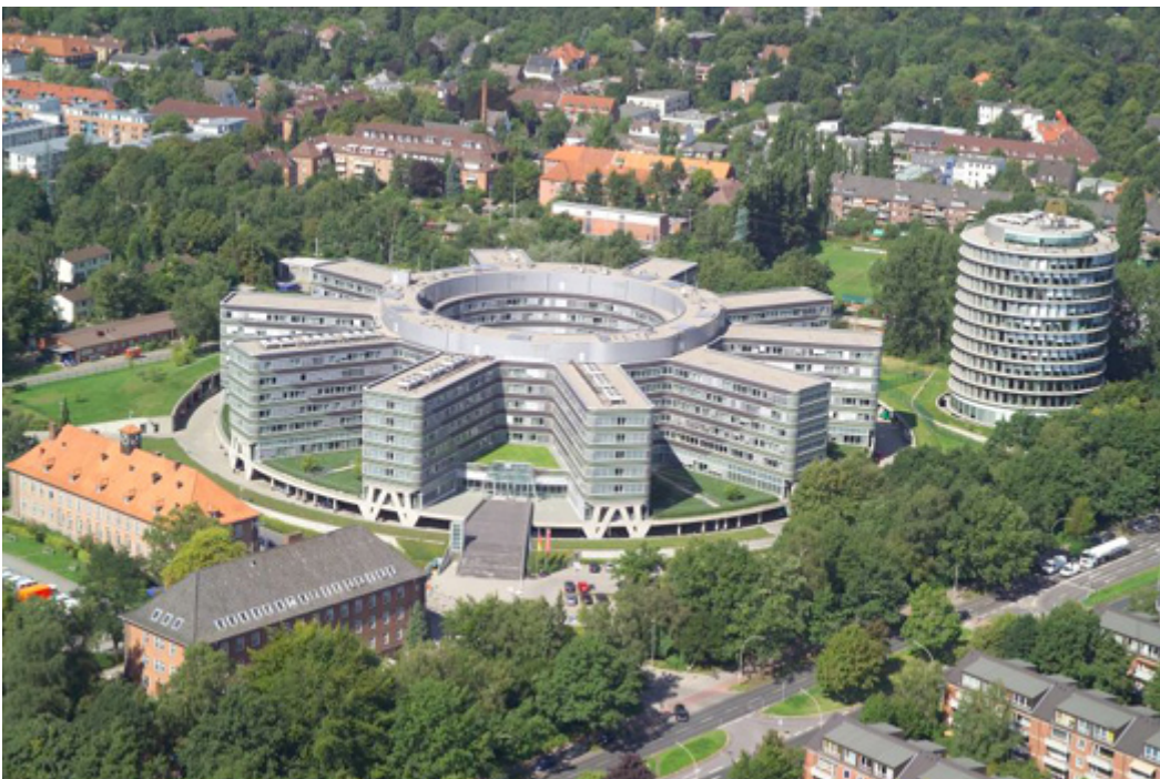
B 2: Polizeipräsidium Hamburg.