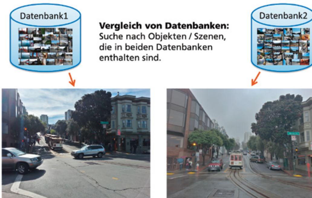
Abbildung 3: Ergebnisse der Batch-Matching Suchfunktion. Gefunden wurde eine Szene, die in beiden Datenbanken enthalten ist.

Als grober Richtwert in Bezug auf die Verwendbarkeit von Daten bei ansonsten guter Bildqualität gilt eine untere Grenze der Gesichtsgröße von etwa 30 Pixeln, um eine gute Wiedererkennungslleistung zu ermöglichen. Dieser Fall liegt meist nur bei Bilddaten vor, die mit einer hochwertigen Digitalkamera aufgenommen wurden. Während bei Bilddaten die Auflösung des Bildes in den meisten Fällen einen guten Hinweis auf die Auswertbarkeit liefert, spielen bei Videodaten noch weitere Effekte, welche die Bildqualität schmälern, eine wichtige Rolle. Beispielsweise wirken sich Kompressionsartefakte, Sensorrauschen und Bewegungsunschärfe mit abnehmender Auflösung stärker aus. Eine zufriedenstellende Qualität wird daher teilweise erst im Bereich von 50 bis 100 Pixel Gesichtsgröße erreicht, wie in Abbildung 4 illustriert. Daher ist es nötig, die zusätzlichen Informationen, die Videomaterial bietet sinnvoll zu nutzen. Dies kann insbesondere dann von Vorteil sein, wenn die abgebildete Person ihren Kopf dreht und somit mehrere Ansichten des Gesichtes enthalten sind wie Abbildung 5 veranschaulicht.