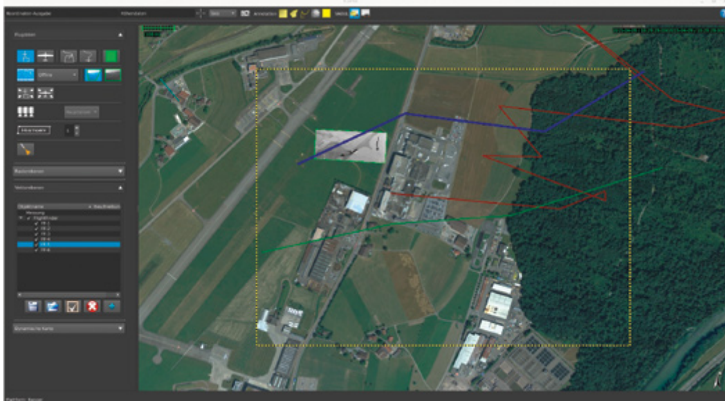
Abbildung 1: Suche nach Bilddaten in einer ausgewählten geographischen Region. Oben: Angabe der geographischen und nicht geographischen Attribute und Darstellung der Ergebnisse in Tabellenform. Unten: Visualisierung der Suchregion und der Flugpfade der Ergebnisse auf der Karte (rechts).

Mit Metadaten werden Informationen wie z.B. Aufnahmezeit und -ort oder Schlagwörter, die mit dem Bild oder Video abgespeichert werden, bezeichnet. Die meisten Systeme bieten Suchen nach diesen Daten an. Hier liegt die Herausforderung vor allem bei sehr großen Datenmengen und bei Aufnahmesystemen, die nicht wie üblich nur einen Satz an Metadaten für ein Video liefern, sondern für jedes Bild in einem Video. Das am Fraunhofer IOSB entwickelte System findet vor allem im Bereich der videobasierten Luftaufklärung Anwendung [1]. In diesem Fall werden für jedes Videobild u.a. die Position und Einstellungen des Sensors (Kamera) sowie des Sensorträgers (Flugzeug) mitgeliefert. Zur Verdeutlichung: Bei einer üblichen Bildrate von 50 Bildern pro Sekunde sind das für 120 Stunden Video mehr als 21 Millionen Datensätze, die analysiert werden müssen. Ein Anwendungsszenario ist die Änderungsdetektion in einer bestimmten Region, z.B. zur Detektion von Schäden an Bahngleisen/Übergängen oder im Fall von Hochwasser zur Detektion von kritischen Änderungen an Deichen. Das System bietet eine optimierte Suche nach geographischen Attributen, so dass in kürzester Zeit alle Bilder/Videos, die eine gewünschte Region zeigen, sortiert ausgegeben und analysiert werden können. Abbildung 1 zeigt beispielhaft die Auswahl einer Region, weitere Suchattribute, sowie die Liste der gefundenen Videos.