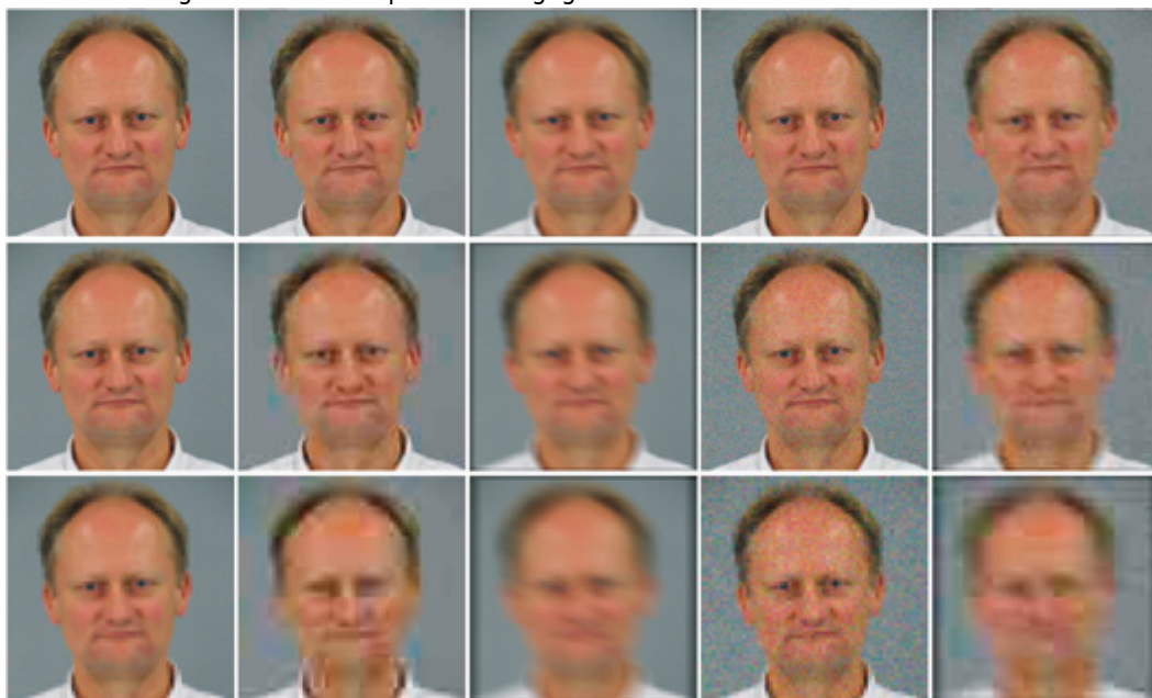
Abbildung 4: Darstellung von Ursachen für schlechte Bildqualität bei unterschiedlichen Auflösungen. Von links nach rechts: Originalbild, Kompressionsartefakte, Bewegungsunschärfe, Sensorrauschen, Kombination dieser drei. Von oben nach unten: Gesichtgröße von 120, 60 und 30 Pixel.