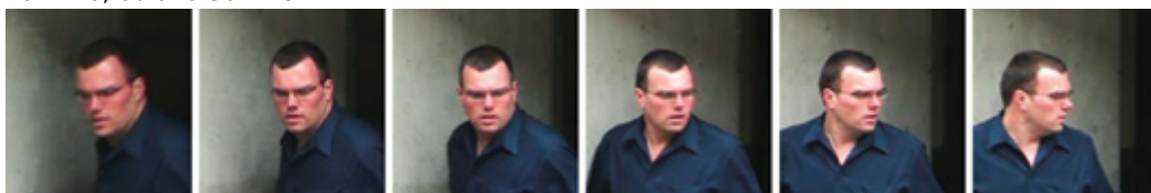
Abbildung 5: Ein Video bietet deutlich mehr Informationen über ein Gesicht, wenn sich die Person während der Aufnahme dreht.

Die Wiedererkennung von Personen auf Basis von Kleidung liefert eine komplementäre Information, die genutzt werden kann, um eine gesichtsbasierte Wiedererkennung zu verbessern. Zusätzlich können kleidungsbasierte Suchverfahren oft auch dann noch angewandt werden, wenn die Daten eine zu niedrige Qualität für gesichtsbasierte Verfahren haben. Analog zur Suche anhand von Gesichtern werden Personenbilder dabei anhand von unterschiedlichen Bildmerkmalen miteinander verglichen. Viele der beschriebenen Eigenschaften lassen sich entsprechend auf die kleidungsbasierte Suche übertragen. Beispielsweise ist es auch hier von Vorteil, Videos mit mehreren Ansichten einer Person für die Suche verwenden zu können anstatt sich auf Einzelbilder mit nur einer Ansicht verlassen zu müssen. Ein wichtiger Unterschied in den Verfahren ist, dass die kleidungsbasierte Suche einen deutlichen Schwerpunkt auf Farbmerkmale setzt und somit – im Gegensatz zur gesichtsbasierten Suche – nur begrenzt auf Grauwertbildern oder -videos einsetzbar ist.