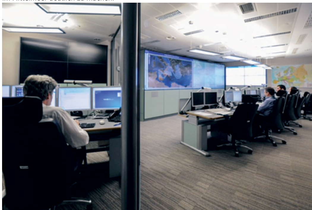
Frontex Situation Center in Warschau

Das in der öffentliche Diskussion heftig umstrittene „European Surveillance System“ -abgekürzt Eurosur - ist ein Rahmenkonzept, das die nationalen Grenzüberwachungssysteme verknüpft, um durch den raschen Austausch von Daten ein zeitnahes Lagebild an den Land- und Seegrenzen zu erzeugen und um adäquate Einsatzmaßnahmen einzuleiten. Mit dem System sollen die Mitgliedstaaten unterstützt sowie Interoperabilität und einheitliche Grenzüberwachungsstandards gefördert werden. Es hängt weitgehend von der Mitarbeit der lokalen Grenzschutzbehörden ab. Der Terminus ist insoweit unzutreffend, weil eine europaweite Überwachung zurzeit technisch gar nicht möglich ist. Gleichwohl erscheint es unverständlich, dass die EU bisher noch nicht versucht hat, einer kritischen Öffentlichkeit den Mehrwert dieses System z.B. für Seenotrettungsmaßnahmen im Mittelmeer deutlich zu machen.