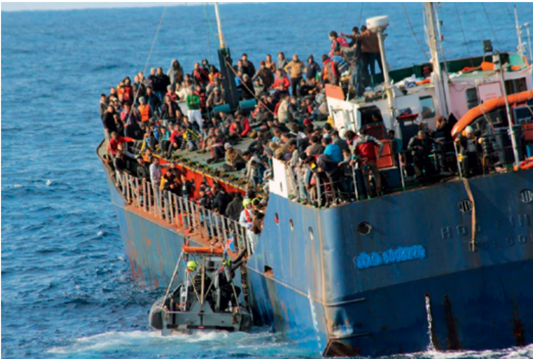
SAR-Aktion von Frontex-koordinierten Einsatzkräften