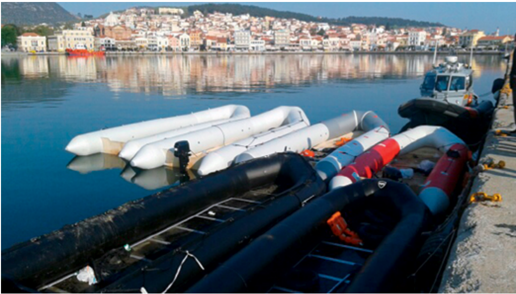
Im Einsatzraum Triton beschlagnahmte Schlepperschlauchboote