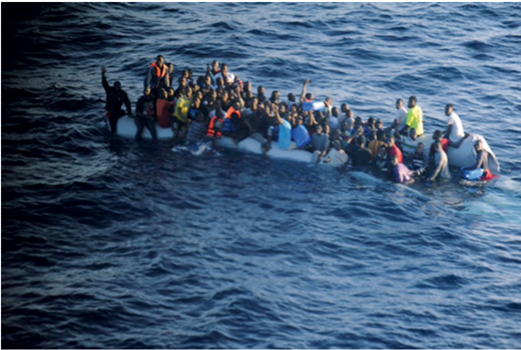
So erzwingen gewissenlose Schleuser Seenotrettungsaktionen